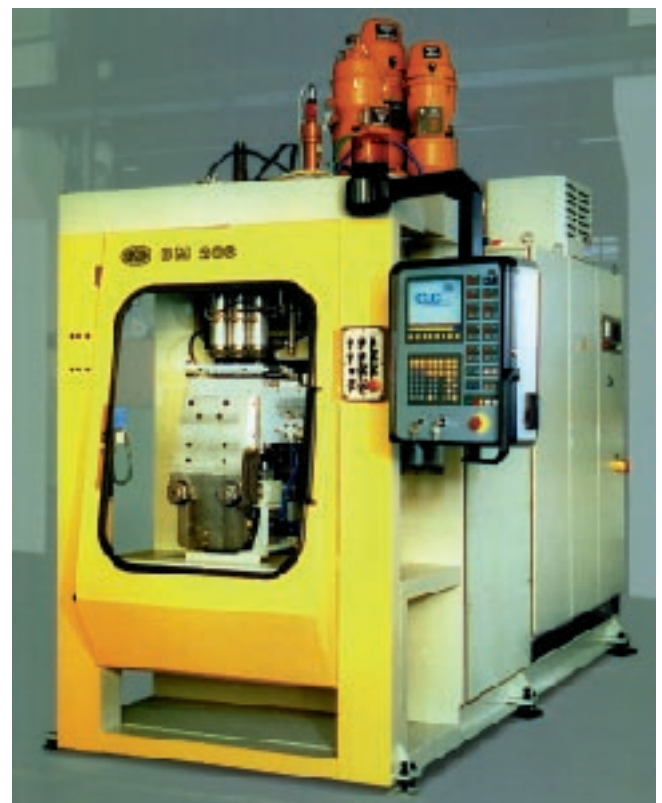
Bild 5: Einstationen-Blasanlage BM 206 mit P-open Automatisierungssystem und bewährter Bedienstation mit IQT (Bekum, Berlin) Fig. 5: Single-station blow molding plant BM 206 with a P-open automation system and the reliable operating terminal