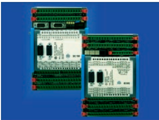
Fig. 4: Apart from numerous I/O and several field bus interfaces, the fast DC 150 control module also has a large memory for real-time storage of process data