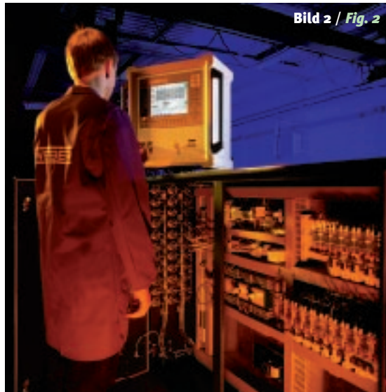
Bild 2 / Fig. 2