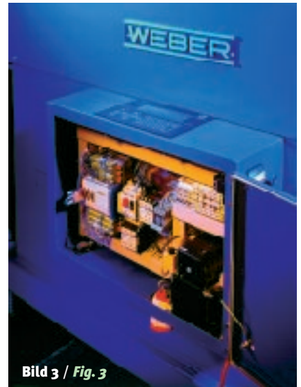
Bild 3 / Fig. 3

onsplanungssystemen z.B. über Ethernet (TCP/IP) und das werkseigene Netzwerk. Bei aktuellen Blasformanlagen werden nach dieser Philosophie auch alle wichtigen Bewegungsachsen wie Schließsystem, Form, Blasdorn und Wanddicken-Steuerung über Proportional-Hydraulikventile geregelt. Welche Vorteile sich auch im Hinblick auf die neuen Möglichkeiten der Informationstechnologie (IT) durch neuartige Feldbus-Module bieten, wird anhand des DC 150 aus dem P-open System deutlich.